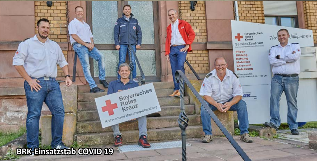
BRK-Einsatzstab COVID 19