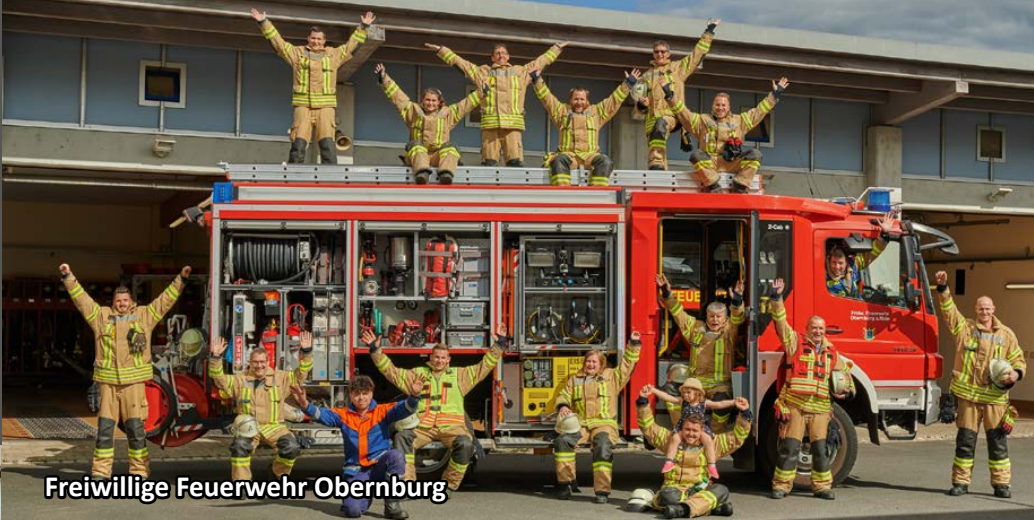
Freiwillige Feuerwehr Obernburg