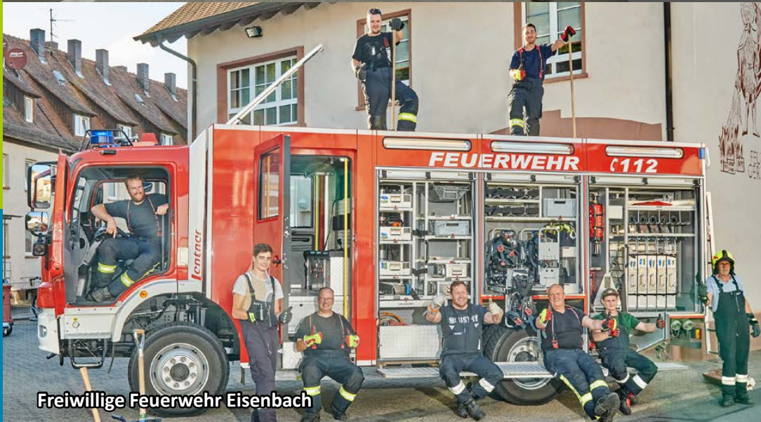
Freiwillige Feuerwehr Eisenbach

Mit dieser Foto-Aktion dankt die Stadt Obernburg die Namen der BürgerInnen, die soziale Einrichtung und Menschen, die besonders in der Corona-Zeit für andere da waren.